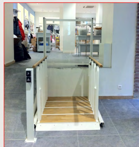
Fig. 1 : Position basse en élévateur

Ce produit est conforme à la directive machine 2006/42/CE