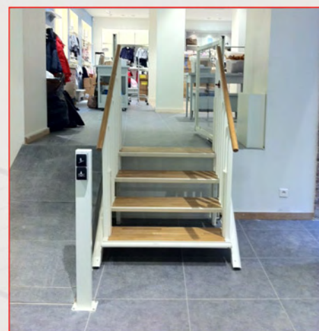
Fig. 2 : Position escalier